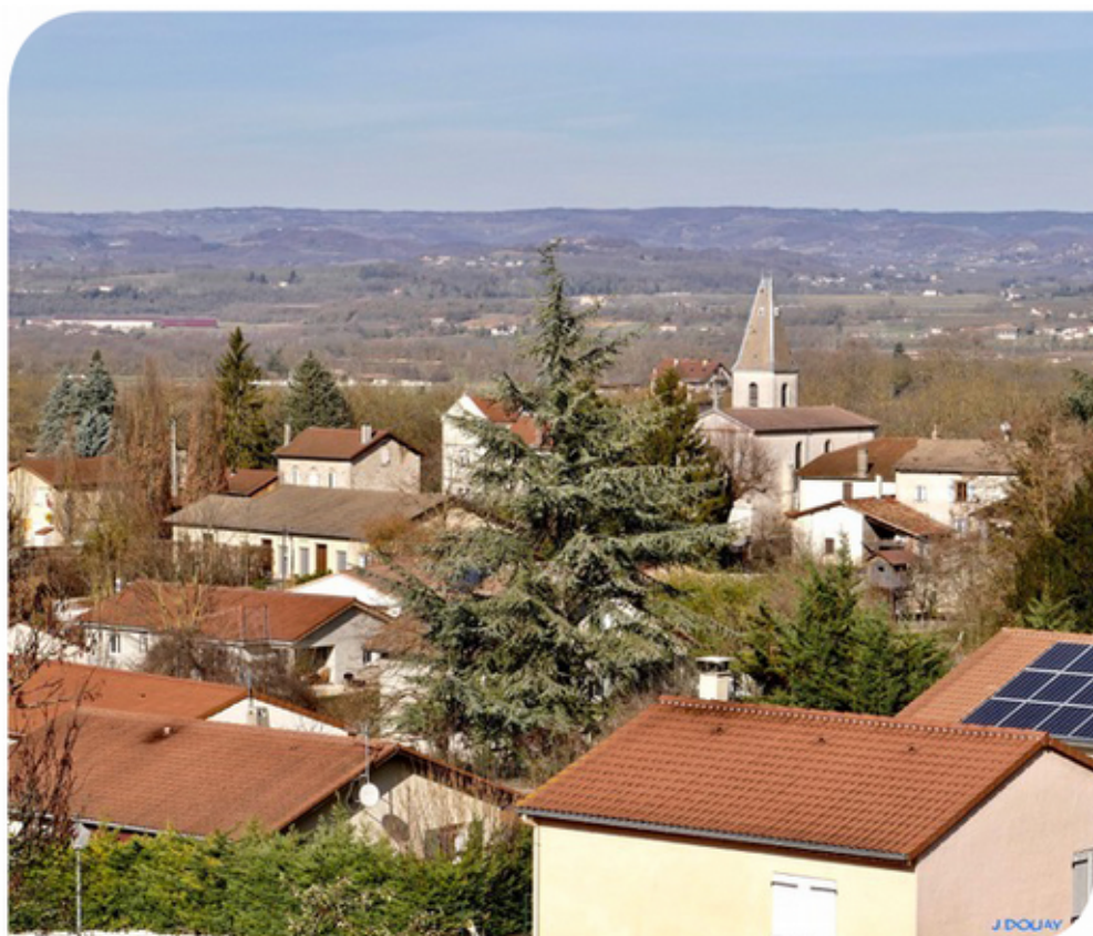
Photo du village